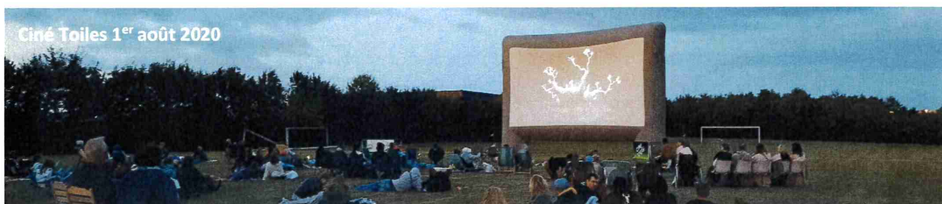
Ciné Toiles 1 er août 2020