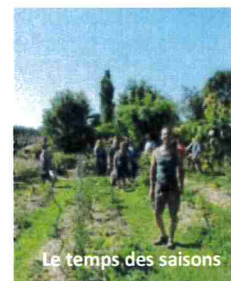
Le temps des saisons

Le site Mon Panier 76 , mis en place par le Département de Seine-Maritime, permet d'identifier rapidement les producteurs locaux. Plusieurs sites de vente sont proposés à Epouville : la boulangerie Dumont, le Verger d'Epouville ainsi que le Temps des Saisons sur le marché du samedi matin. www.monpanier76.fr