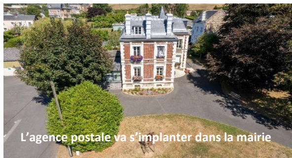
L'agence postale va s'implanter dans la mairie

Du lundi au vendredi de 9h00 à 17h00, le samedi de 10h à 12h Consultez les dernières informations sur www.epouville.com