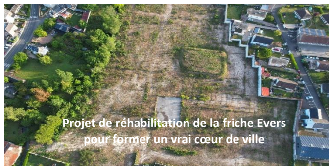
Projet de réhabilitation de la friche Evers pour former un vrai cœur de ville