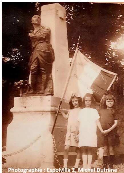
Espovilla 2

A l'occasion de son inauguration, en 1921, trois fillettes des familles Hérou, Michaux et Vasset, avaient été photographiées au pied du monument.